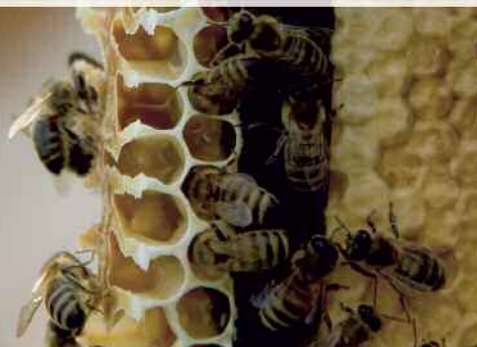
Bienenwabe im Querschnitt